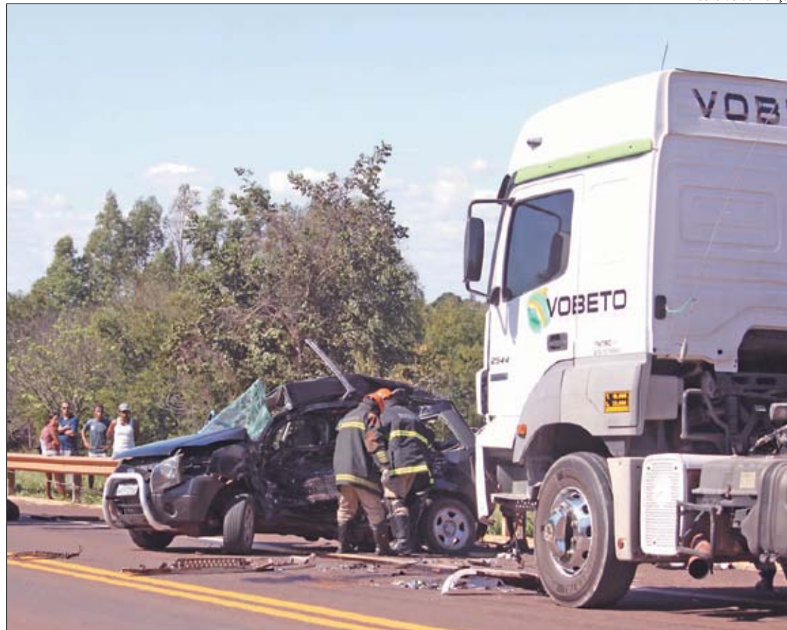
Bombeiros foram acionados para retirar o corpo da vítima das ferragens; o motorista morreu antes do socorro